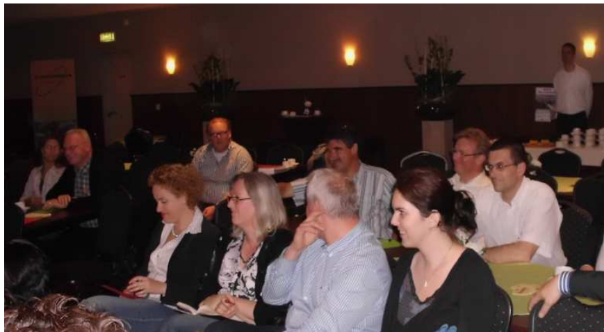
Betrokkenheid was er zeker!

Discussieavond gericht op behoud van Junior College