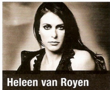
Heleen van Royen